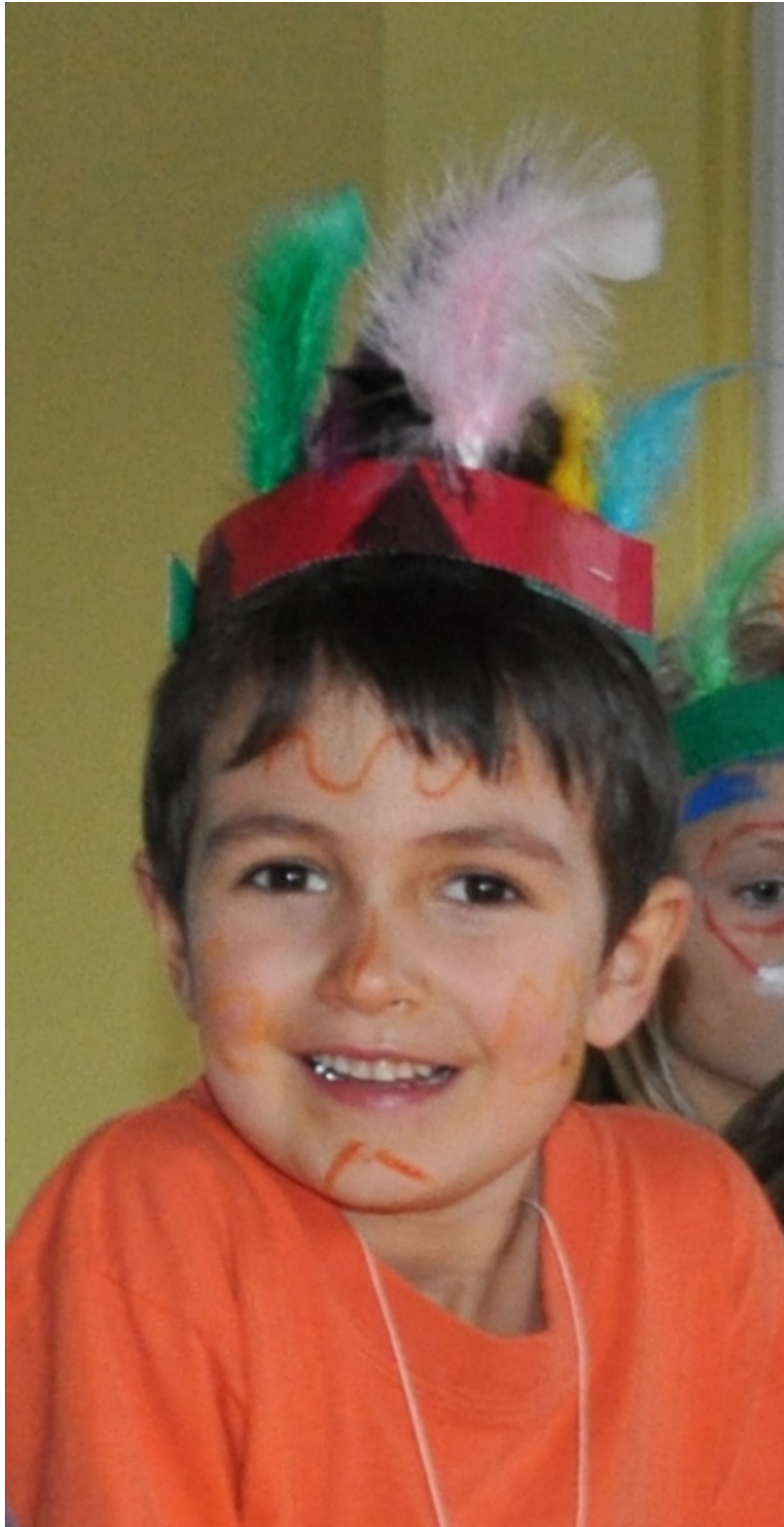
Indianerparty (2.Kindergartenjahr): Für jede bestandene Aufgabe, gab es eine Indianerfeder in die Krone.