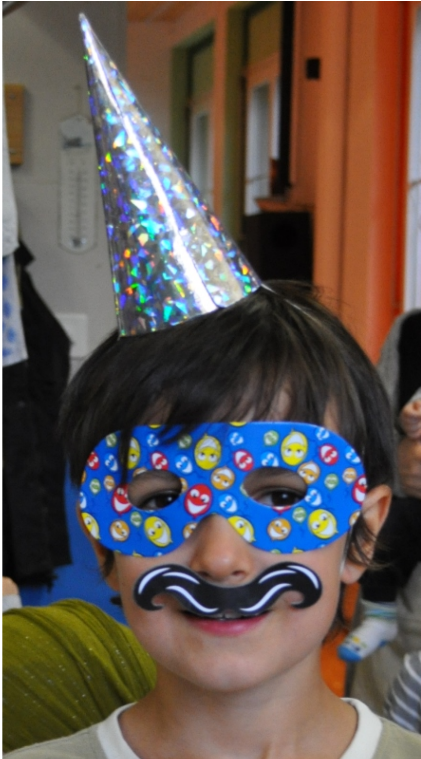
Spass mit Tischbombenmaterial

Die Kinder freuen sich inzwischen sehr auf meine Recyclingtischbomben , die ich mit selbstgewähltem Material fülle.