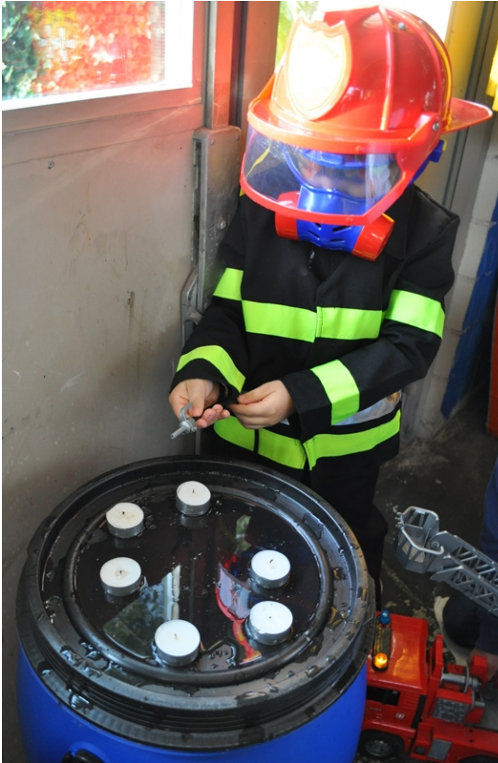
Feuerwehrparty (1.Klasse): An diesem Posten löschten die Feuerwehrfrauen und Feuerwehrmänner fleissig Feuer.