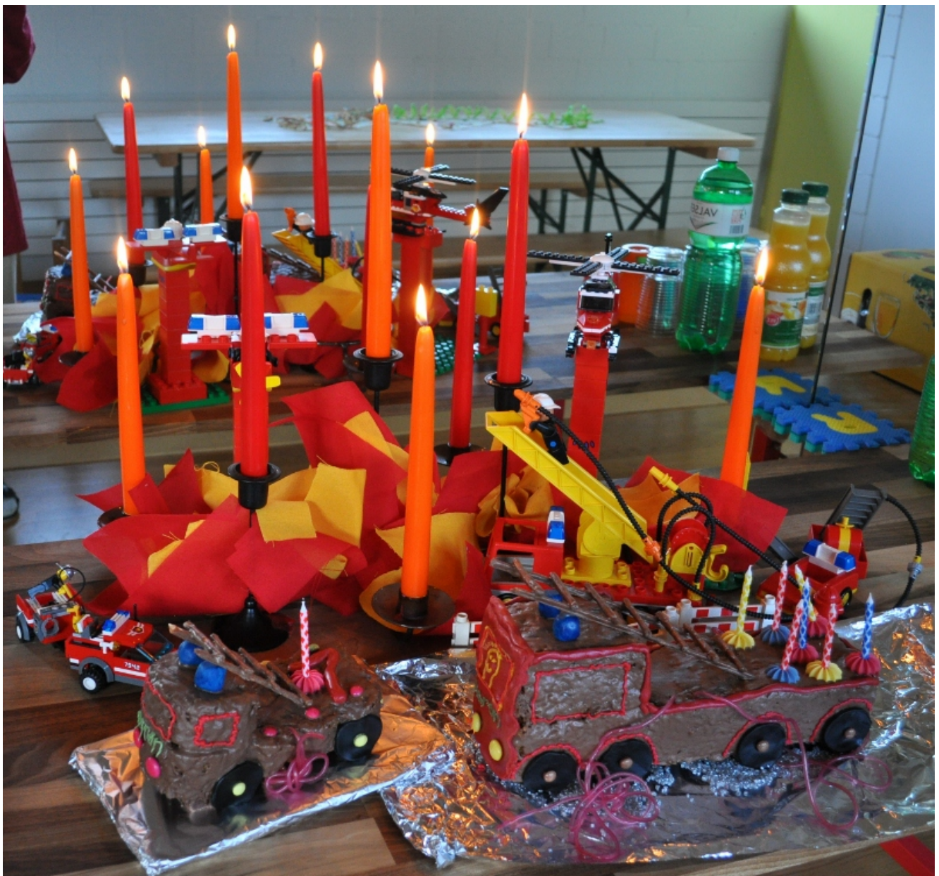
Feuerwehrtorten von einem Tageskindmami gebacken.