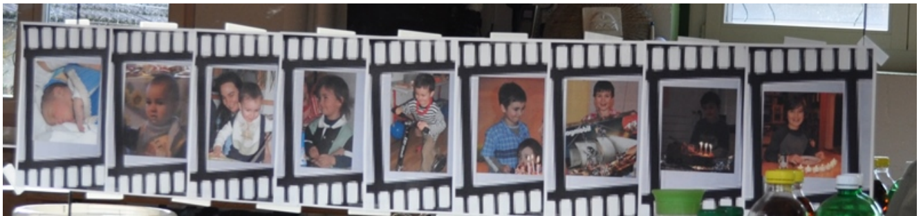
Kinofilmübernachtungsparty (3.Klasse): Das grosse Thema zu diesem Geburtstag war Film.