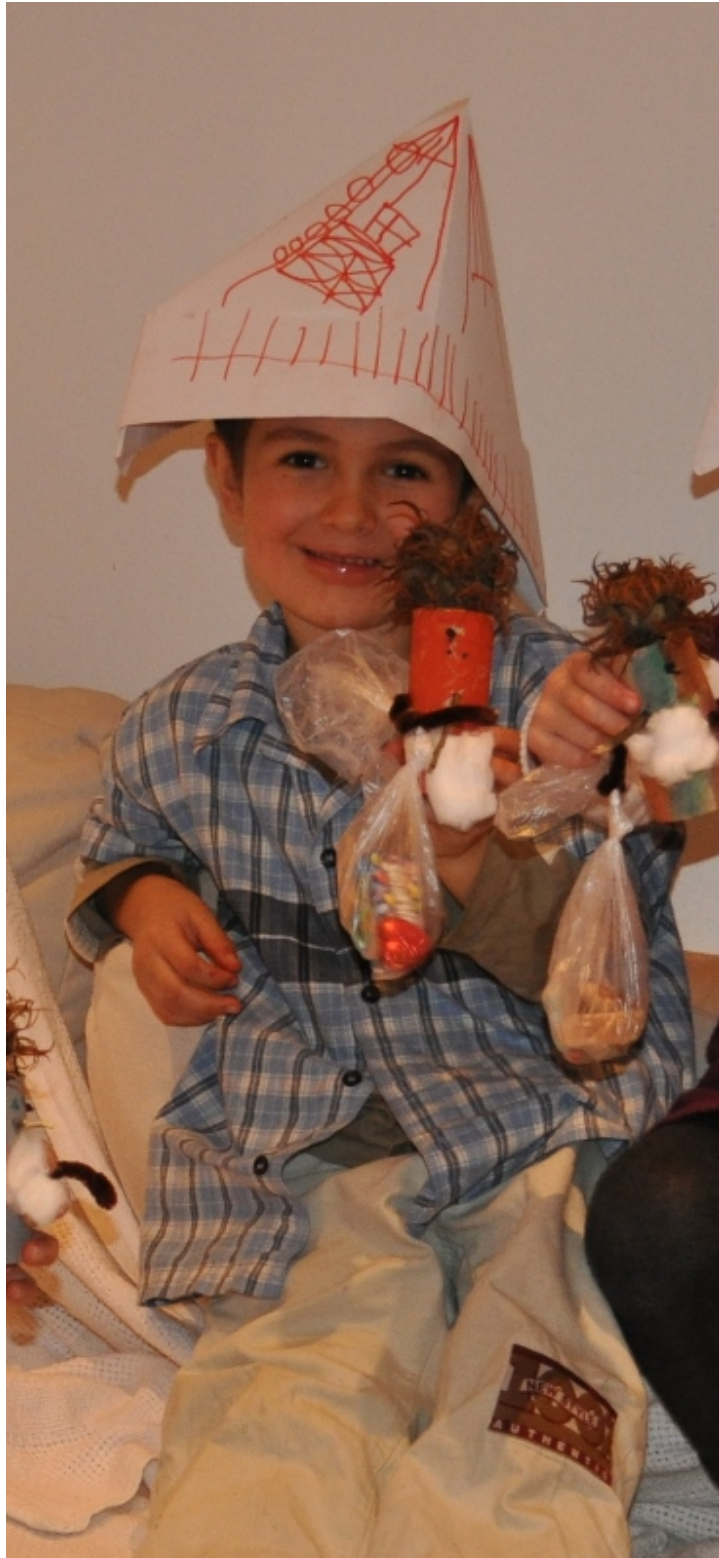
Zwergenparty (1.Kindergartenjahr): Mit Zwergenhut und Erinnerungsbastelzweig kehrten die Kinder nach Hause zurück.