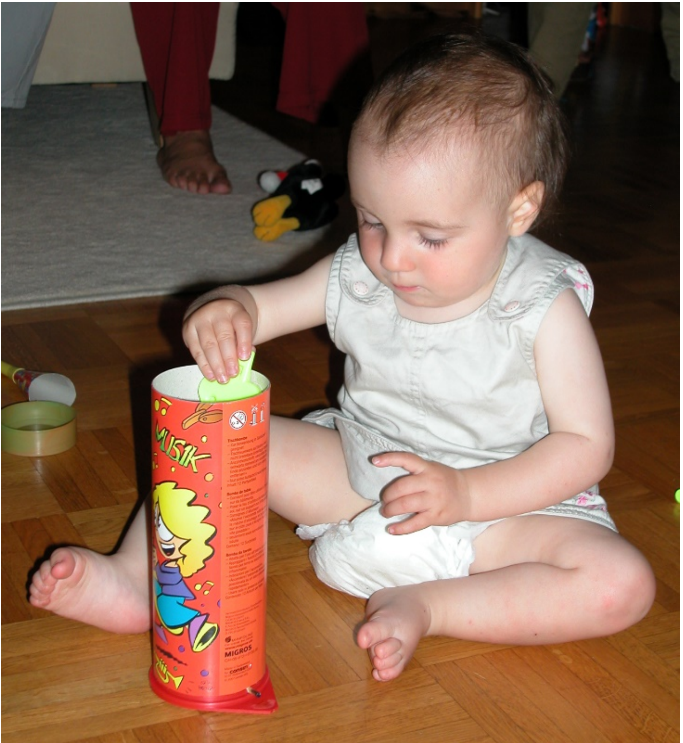
Meine Tochter hatte bereits Spass an ihrem 1. Geburtstag an einer Tischbombe.