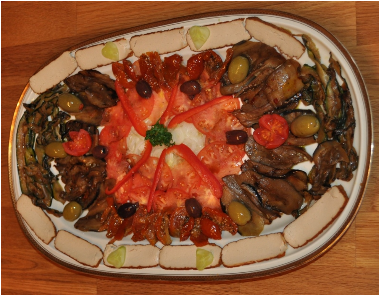
Vegane Festplatte mit Räuchertofu-gegrilltes Gemüse-Tomaten-Zwiebel-Carpaccio