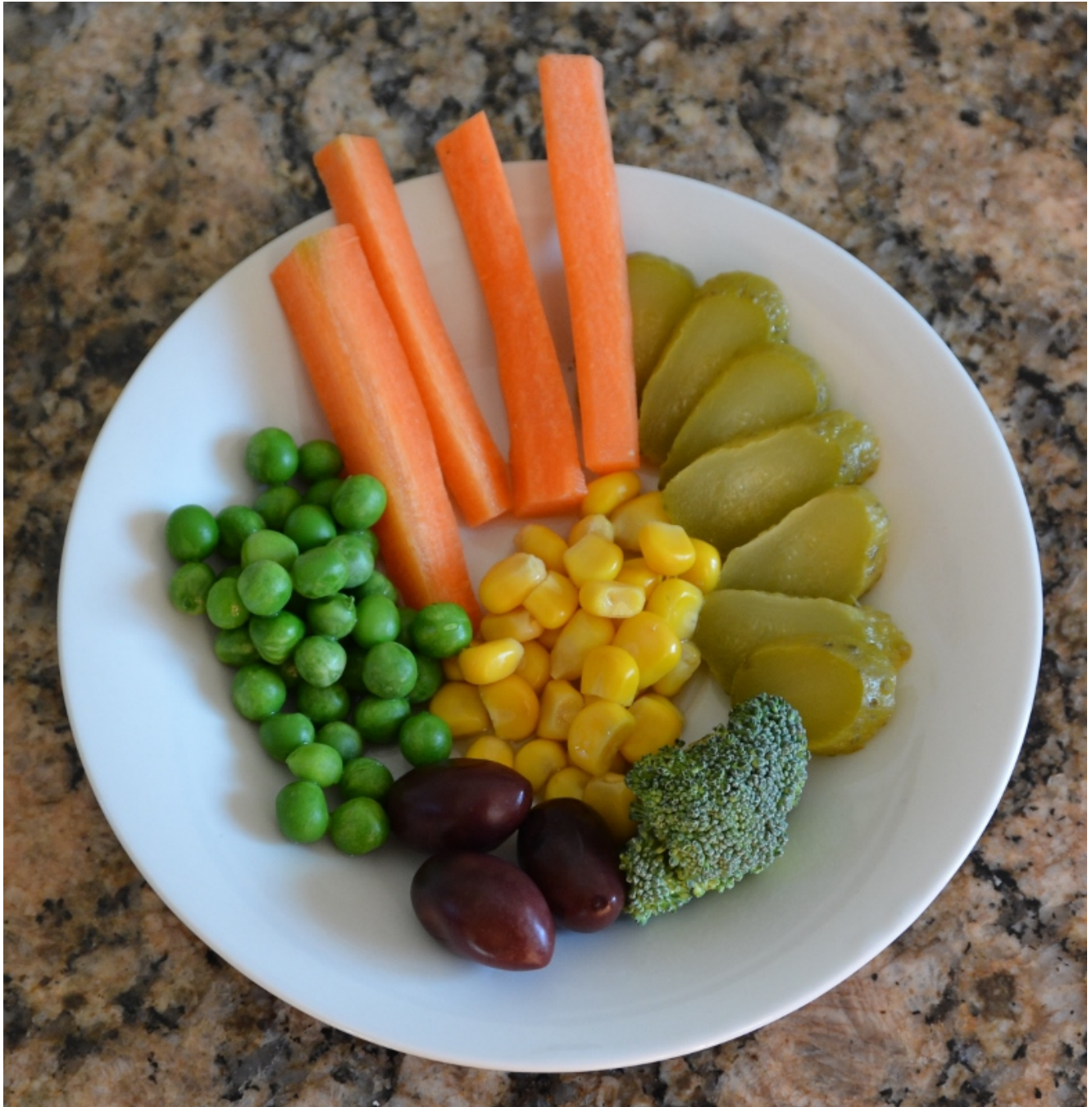
Herbstteller: Essiggurken, Mais aus dem Glas, Karotten, Oliven, Broccoli und Erbsen (waren gefroren und vom Vortag)

eingelegtes Gemüse wie Essiggurken oder Tomaten, Oliven ... . Gelegentlich gestalten meine Kinder ihren Aperoteller selber.