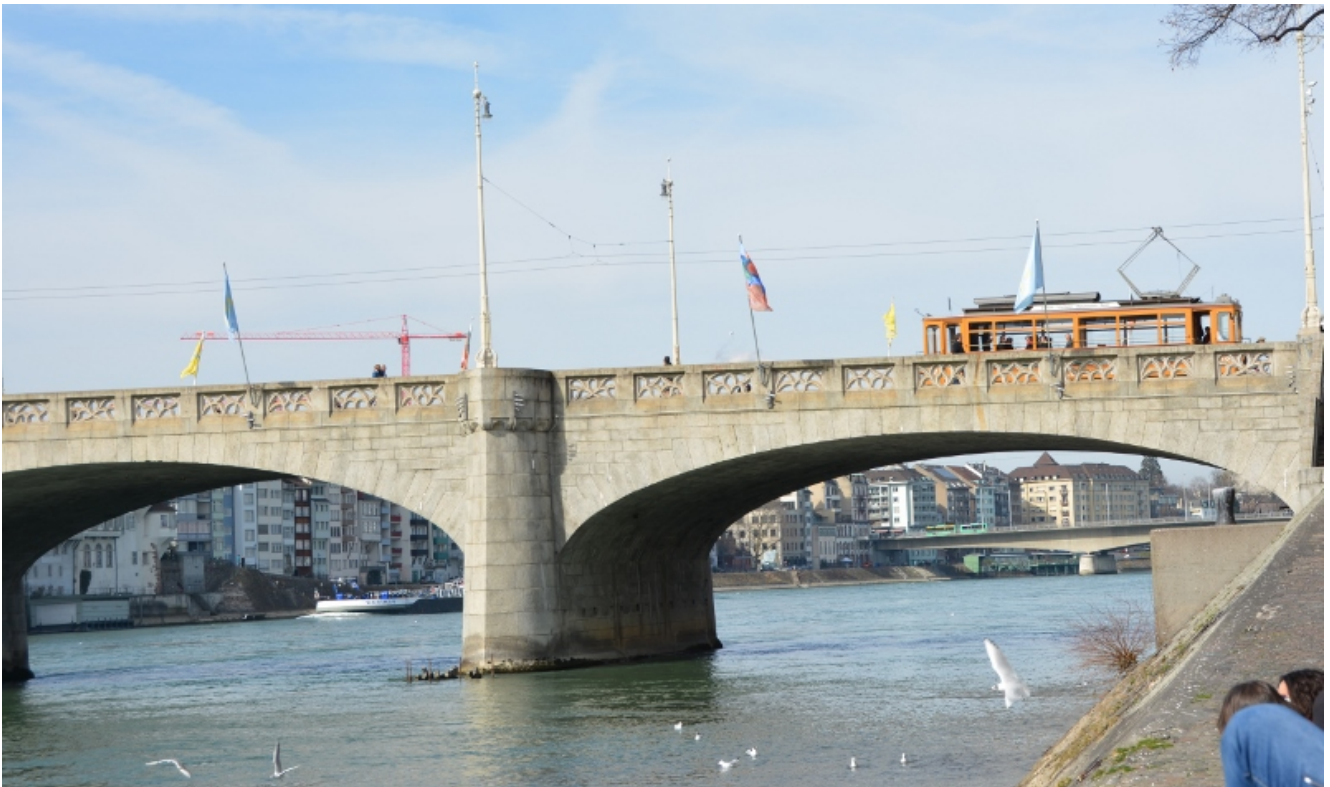
Frachter-Schiff, altes Tram und Luftakrobatik bei warmen