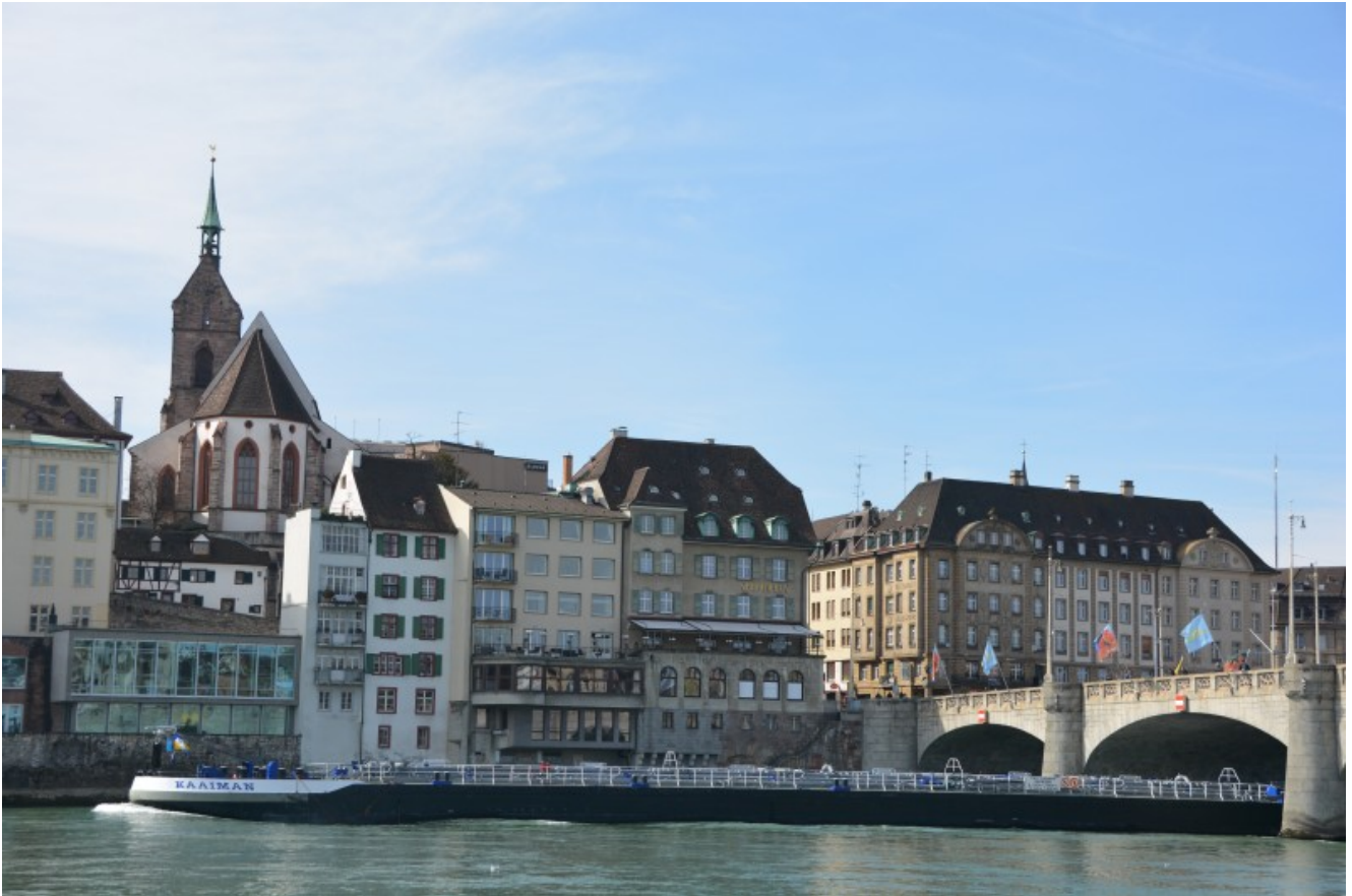
Blick auf den Rhein und die Altstadt.