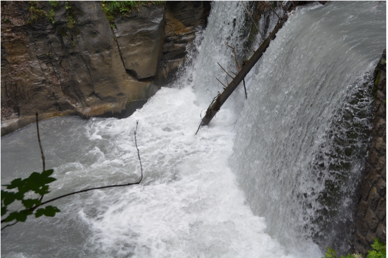
Die Kinder staunen über die ganzen Baumstämme im Wasser.