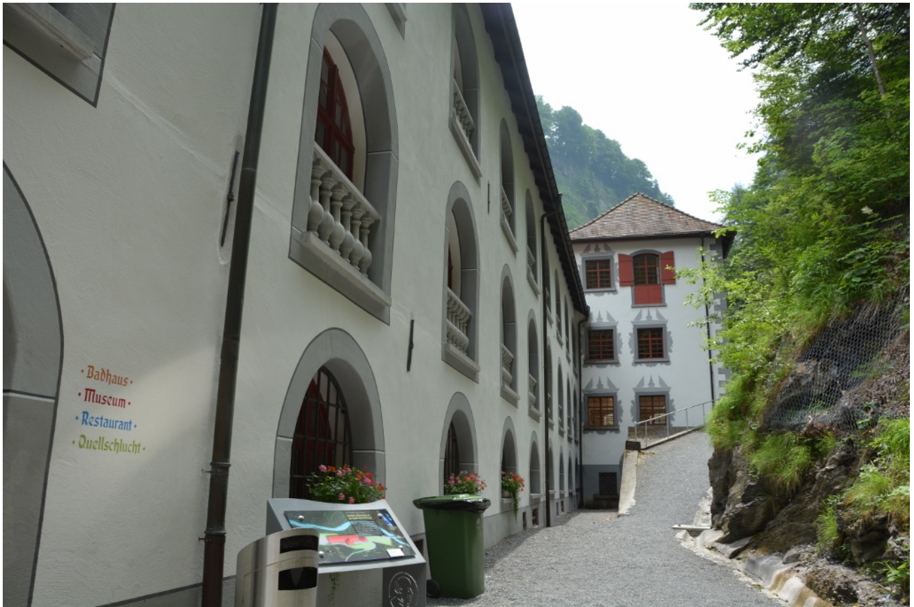
Das alte Bad besitzt ein Museum, ein Restaurant und Plätze zum Picknicken.