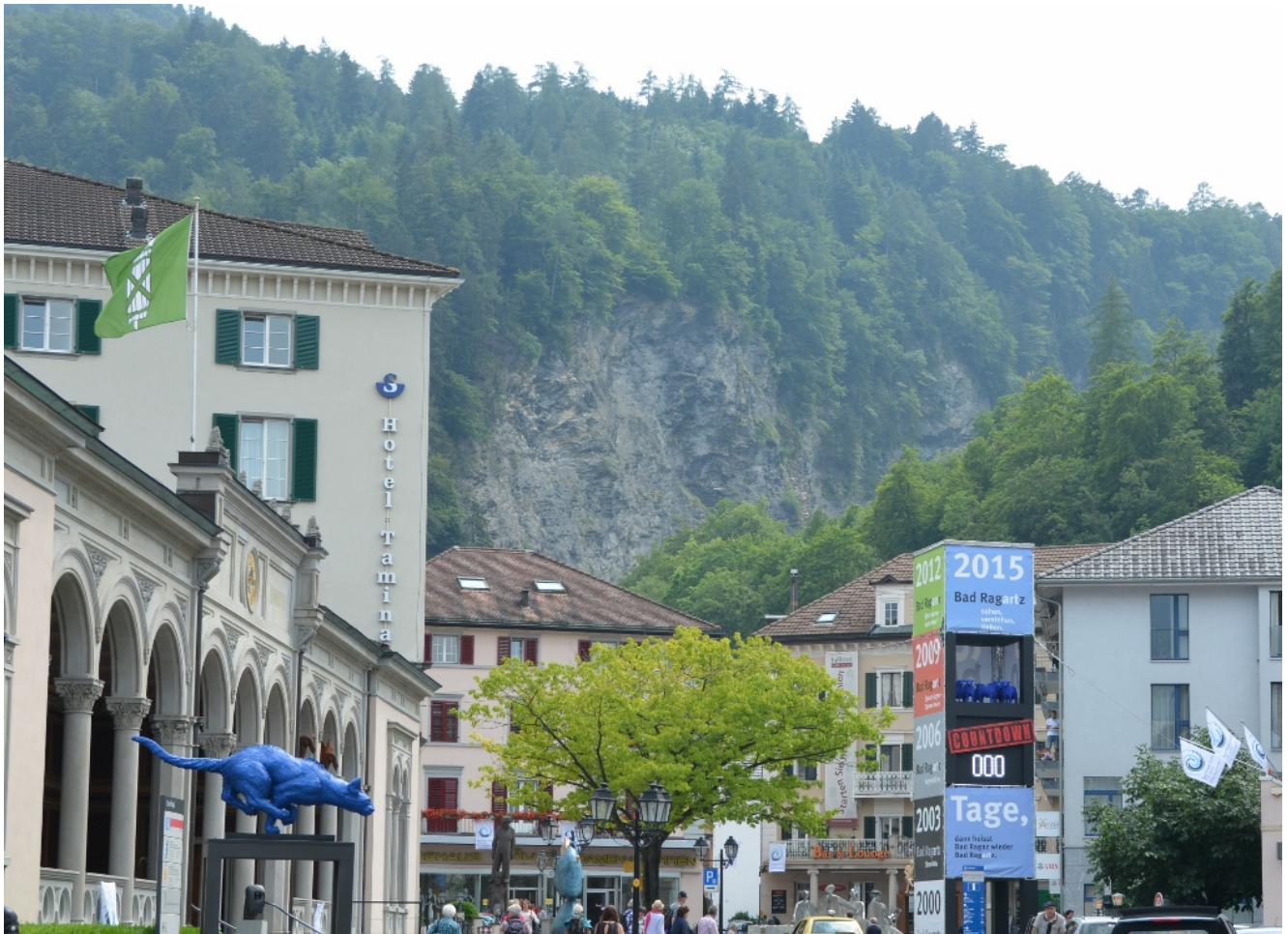
Bad Ragaz am 10 Juni 2015

Dabei entdecken wir einige der Skulpturen, die in Bad Ragaz ausgestellt sind. Die grösste europäische Skulpturenausstellung befindet sich in Bad Ragaz. Uns gefallen die Skulpturen sehr und die Kinder sind auf ihre Weise davon angetan.