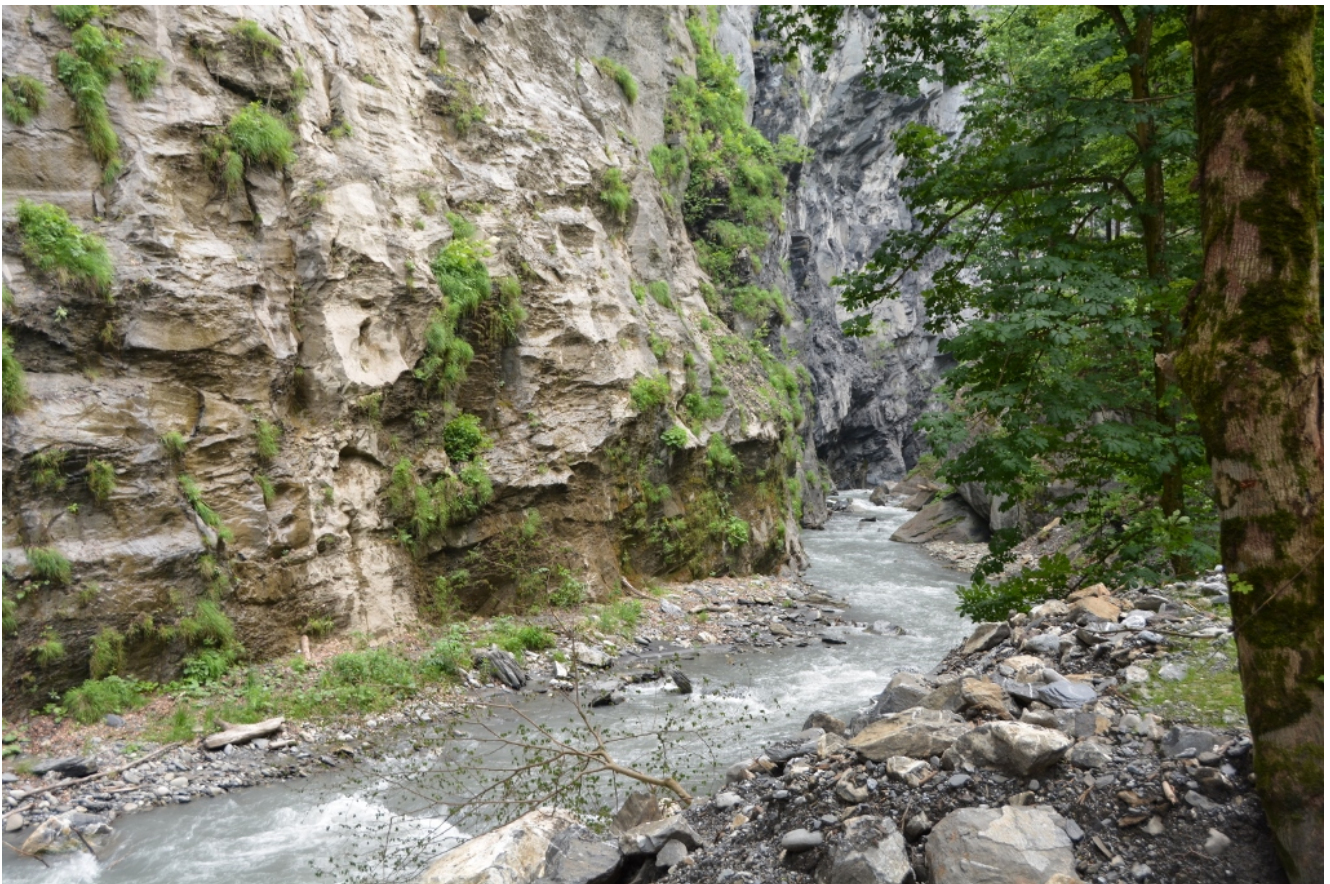
Die Felshänge, die senkrecht und manchmal überhängend sind,