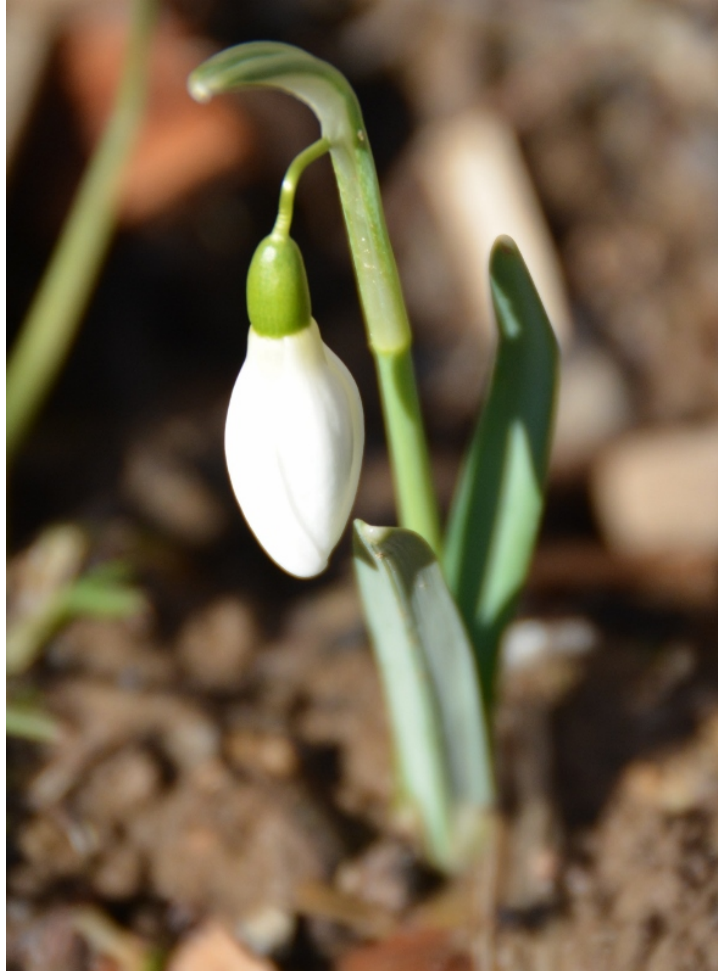
Erste Schneeglöckchen im Februar 2016

Winter zu schenken nicht sinnvoll. Am liebsten habe ich lebendige Blumen im Garten. Im Februar freue ich mich, wenn ich die ersten Schneeglöckchen, Schneerosen und Primeln entdecke.