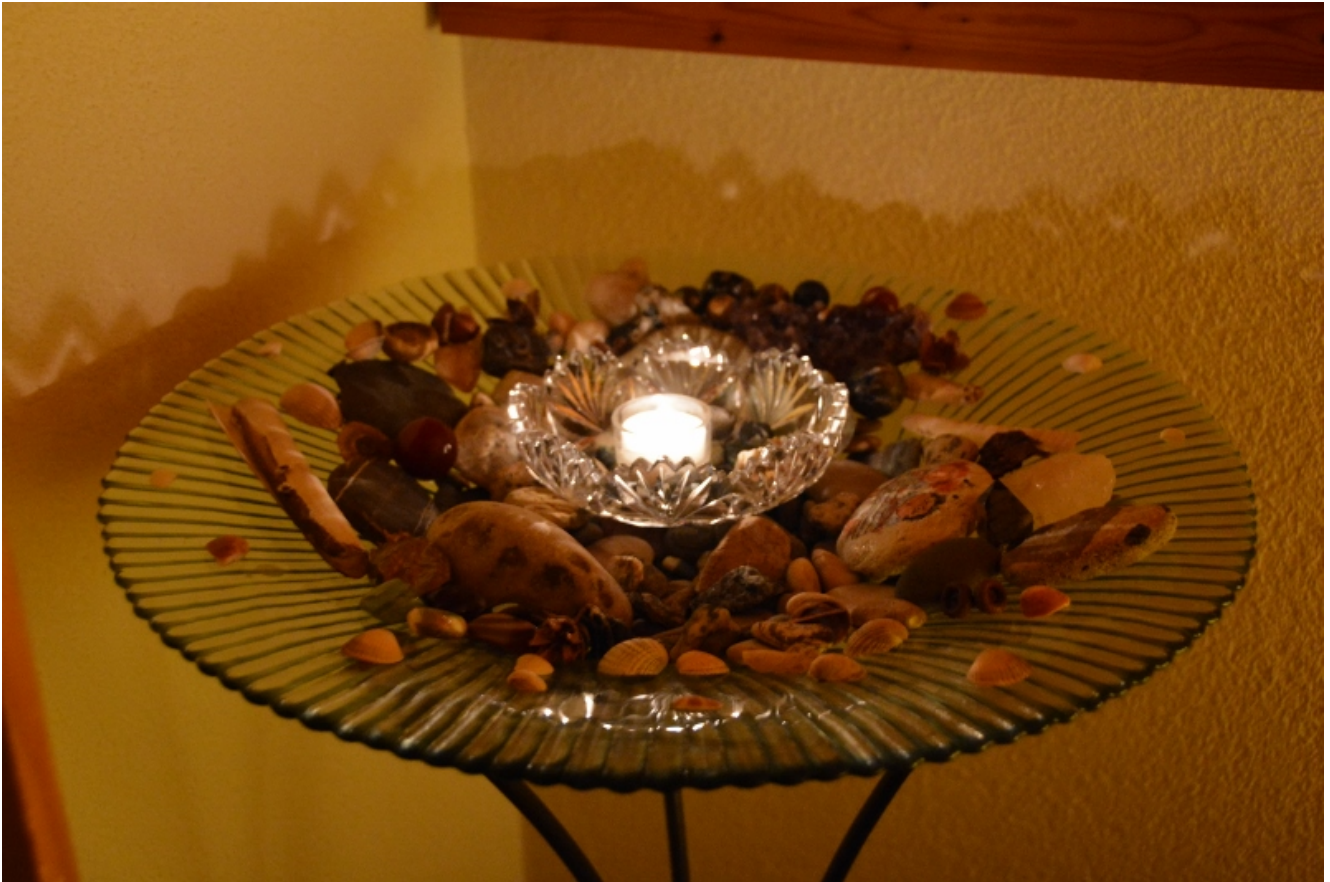
2. Februar Lichtkerze für Weiblichkeit (2016)