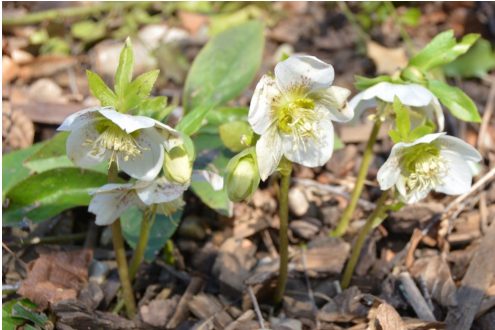
Blühende Schneerose im Februar 2016