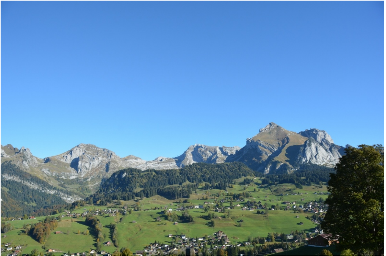
Blick vom Schwendihof auf den Säntis (16.10.2016)