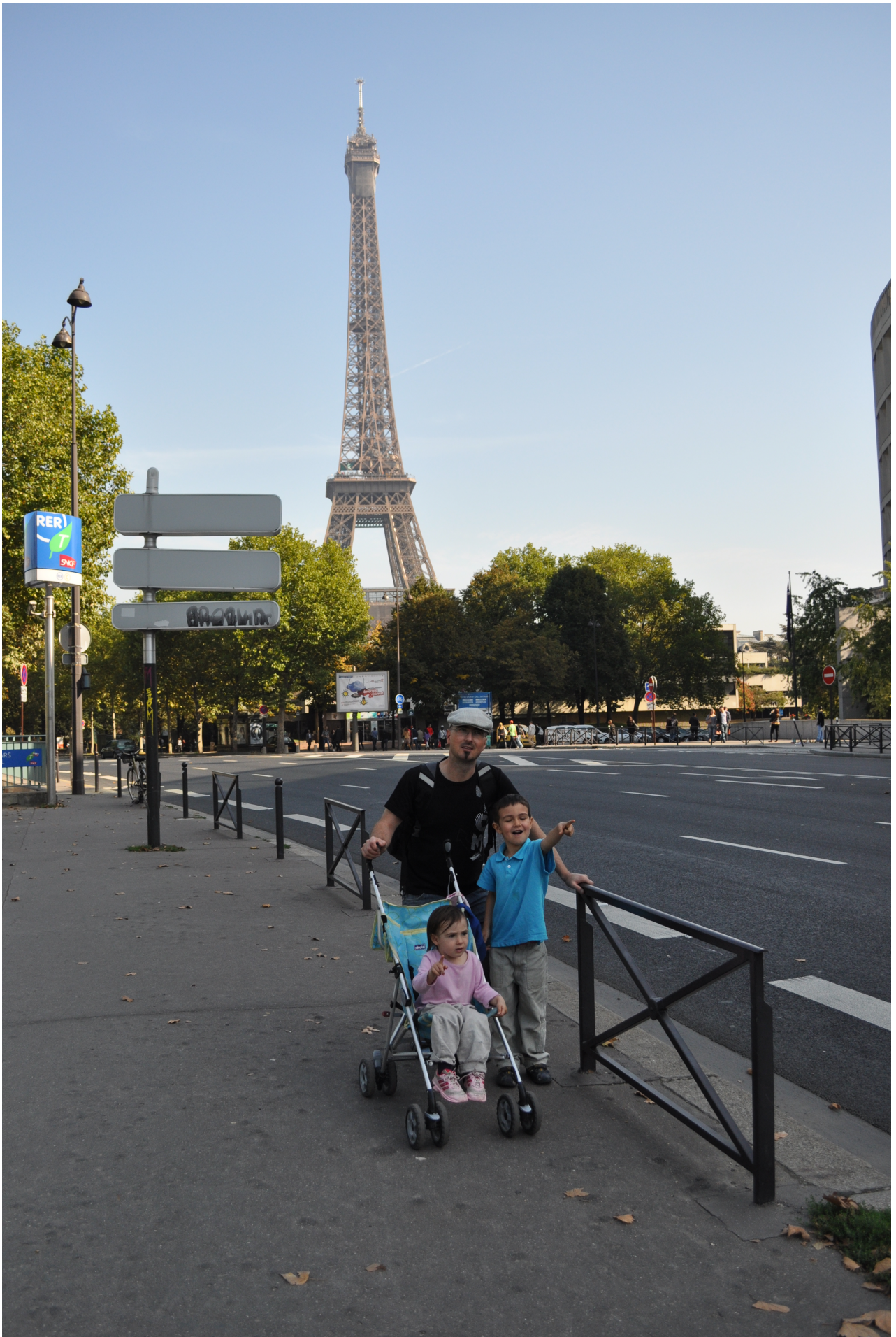
Wunderschöne Städte Europas lernten wir kennen.