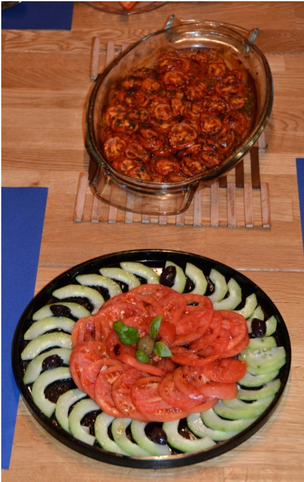
Halbgetrocknete Tomaten und Caspaccio bestehend aus dünnen Tomaten- und Gurkenscheiben

Zum Dessert geniessen wir Trauben, Äpfel, Birnen, süsse Brombeeren und Heidelbeeren.