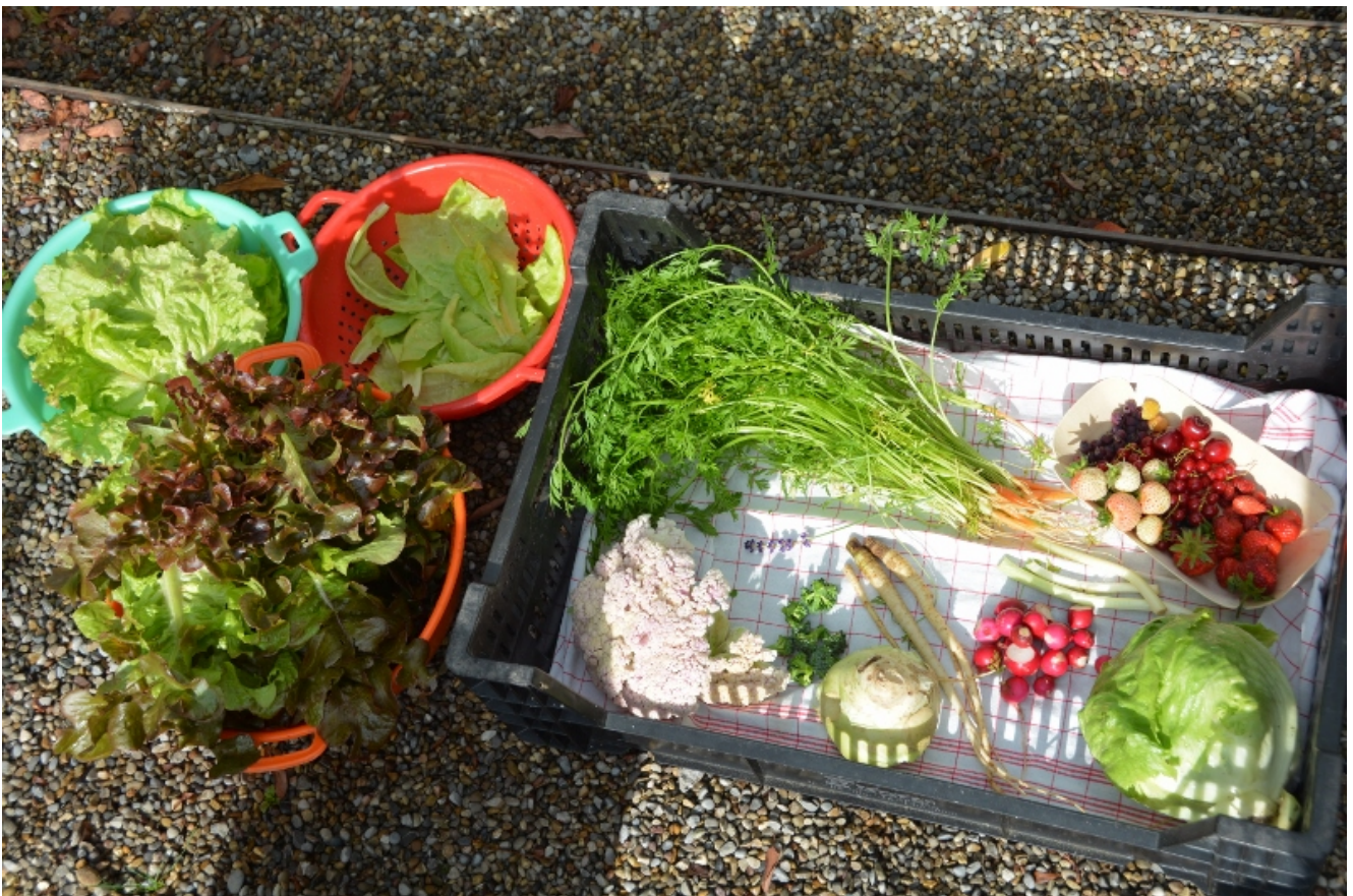
Bereits dürfen wir Vieles ernten.