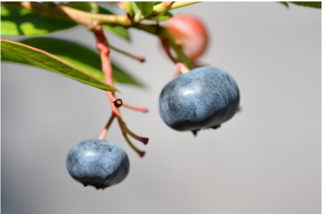
Die Heidelbeeren schmecken süß und fruchtig.