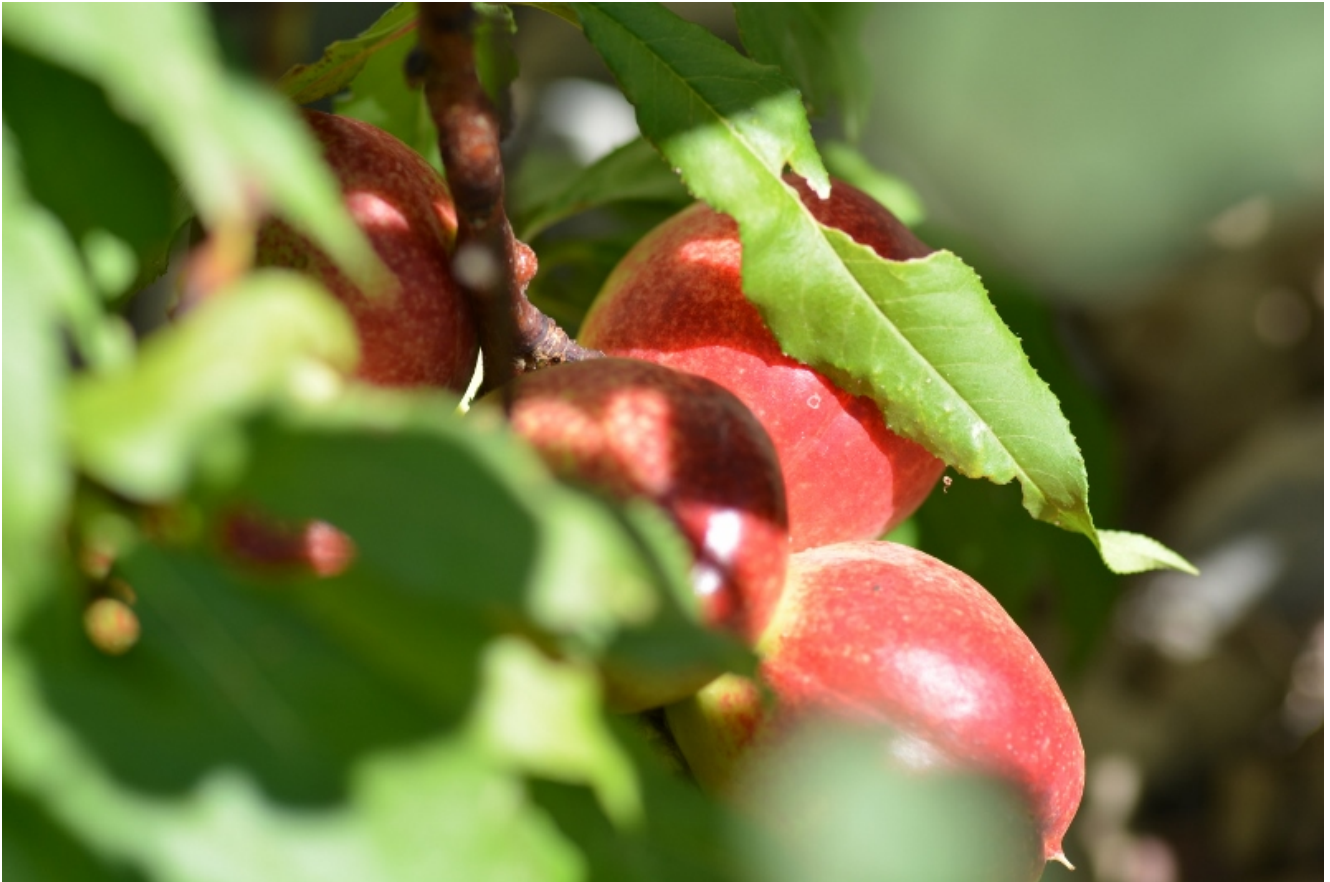
Die Zwergnektarinen zeigen sich in roter Farbe.