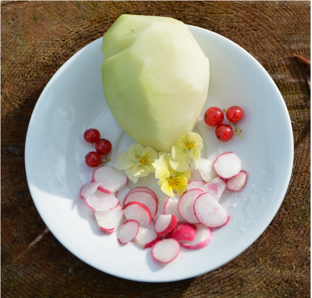
Die letzten Frühlingsgemüse wie Radieschen und Kohlrabi gibt es auf unseren Sommersonnenteller.