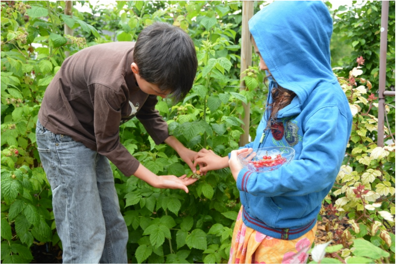
Die Kinder ernten gerne Beeren.