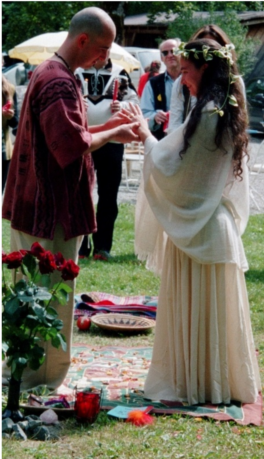
In Verbindung zwischen Himmel und Erde