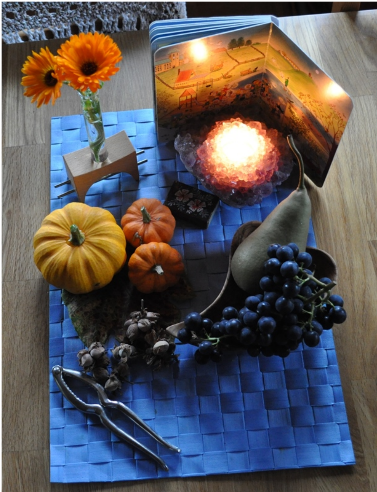
Eine Kerze umringt mit herbstlicher Dekoration

Auf dem Tisch brennt nun auch wieder regelmässig am Abend eine Kerze umringt mit Herbstdekorationen.