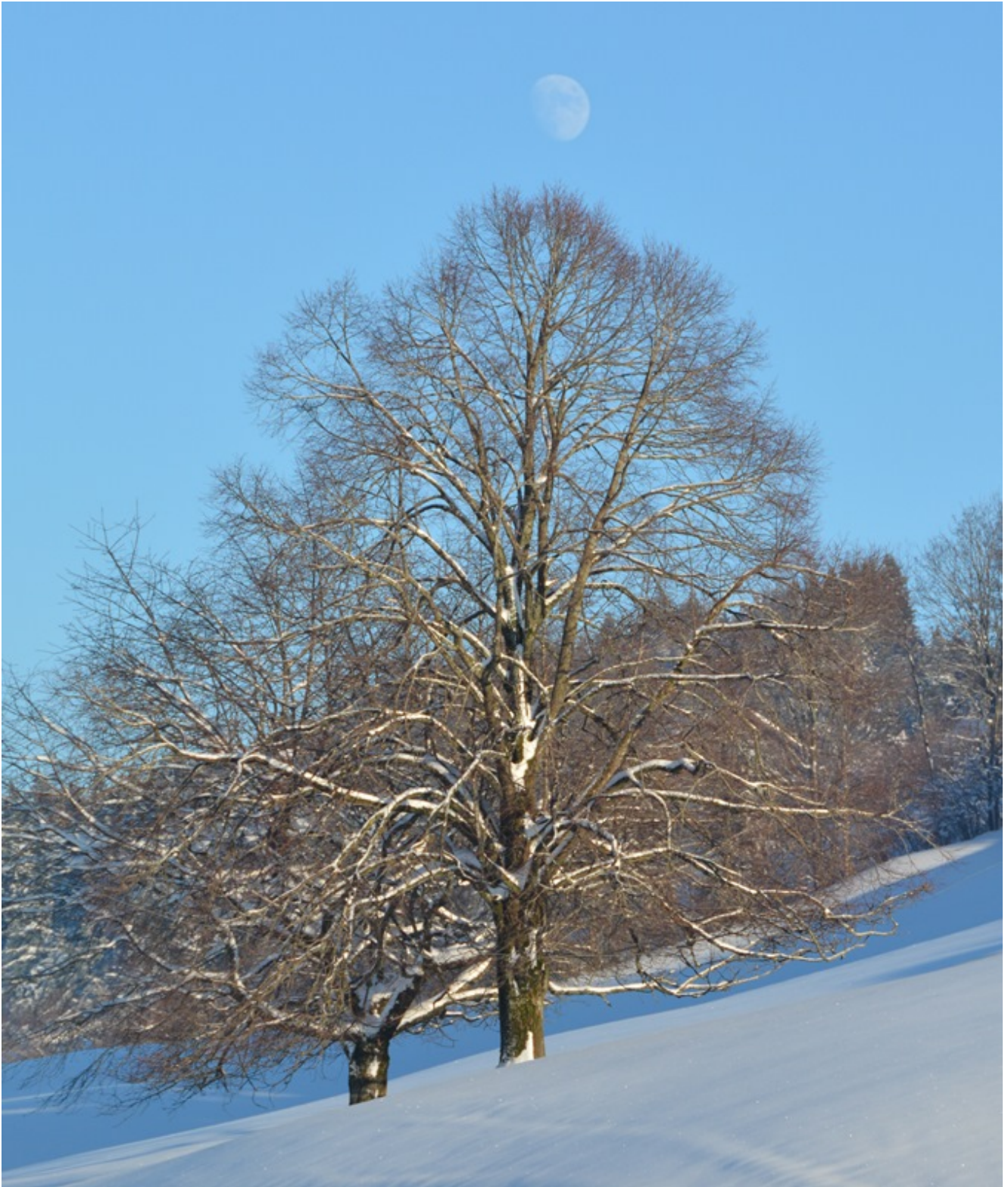
Traumwinterlandschaft zu Beginn des 2015