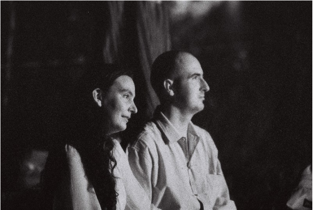
Stille Momente am Feuer