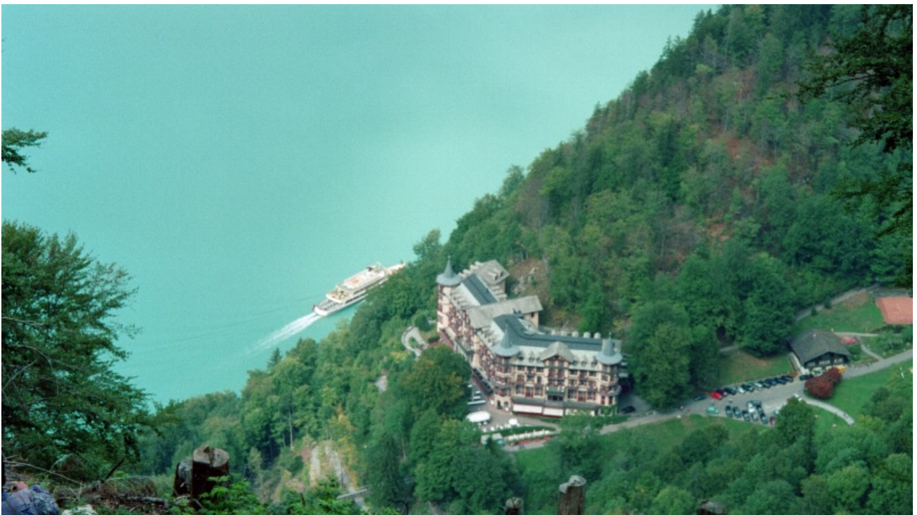
Auf der Wanderung ging es steil abwärts.