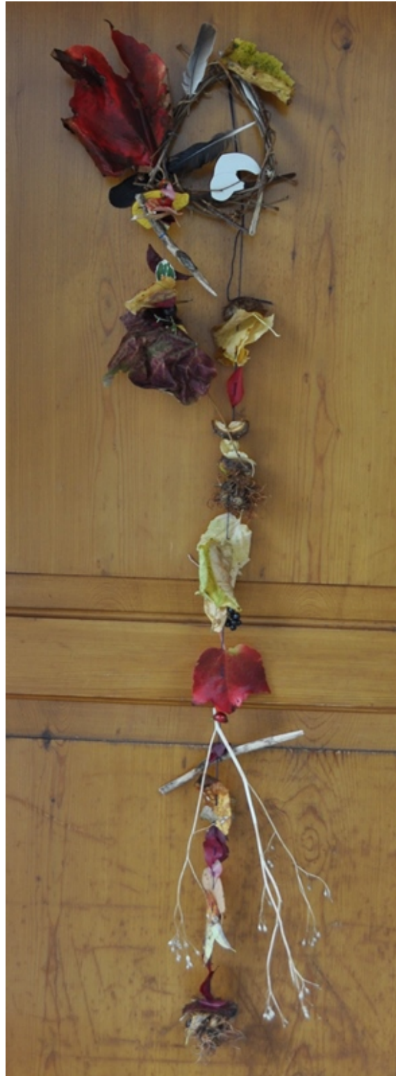
Herbstdekoration an der Eingangstüre