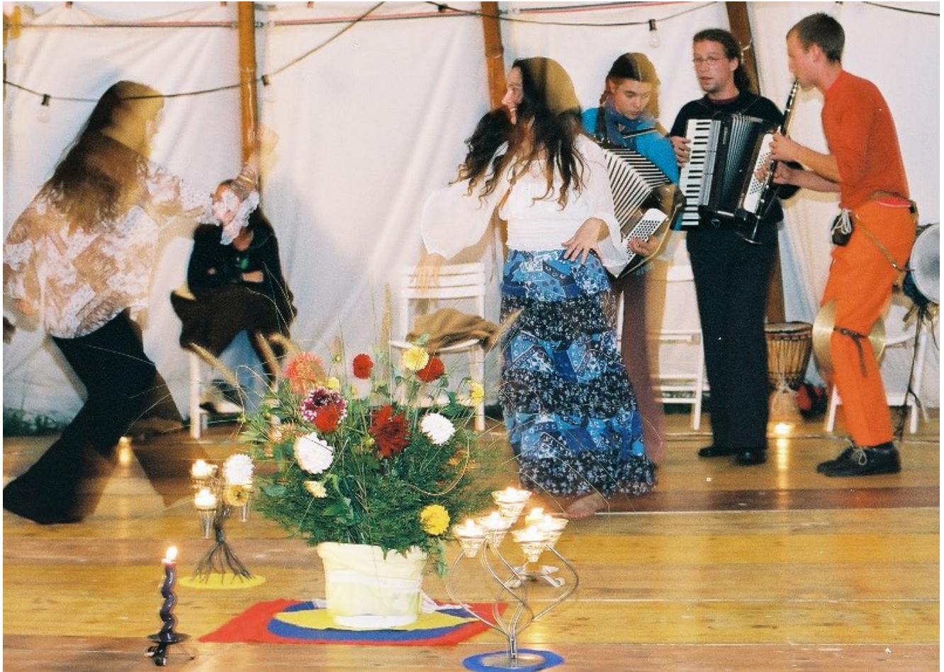
Tanzen im Rundzelt