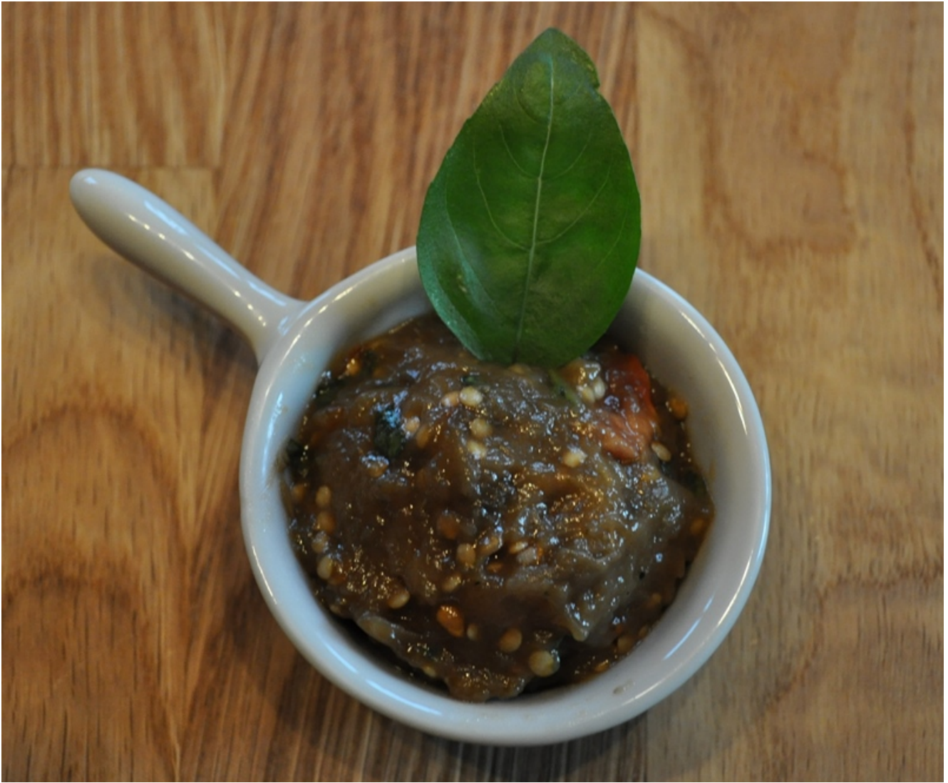
Auberginen-Tatar aus gegrillten weissen Auberginen

Wir lernen ein neues Herbstlied. Dieses Jahr lernen wir Bunt sind schon die Wälder . Wir machen uns Gedanken, was für uns Herbst bedeutet und sprechen über die Herbstzeit. Gemeinsam schauen wir uns das Herbstwimmelbuch an.