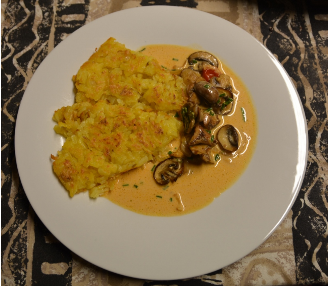
Röstli mit weisser Pilzsauce

Dazu passen für uns am besten Pilzsaucen ( Pilz-Sauce , cremige Pilz-Sauce , Tofu-Stroganoff ). Gerne belege ich die Röstli manchmal einfach auch mit frischen dünn geschnittenen Tomaten.