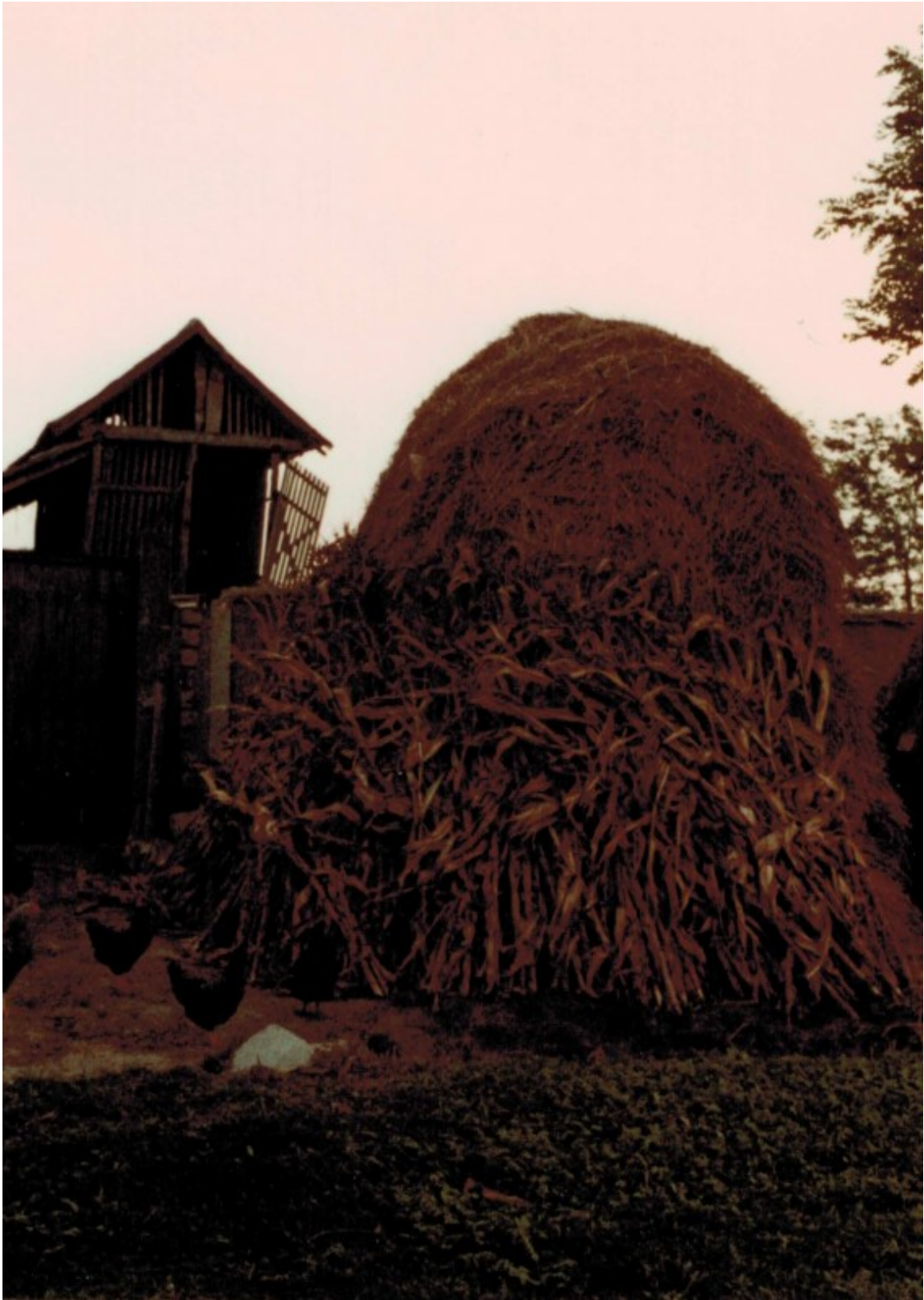
Unten links sind Hühner zu sehen.