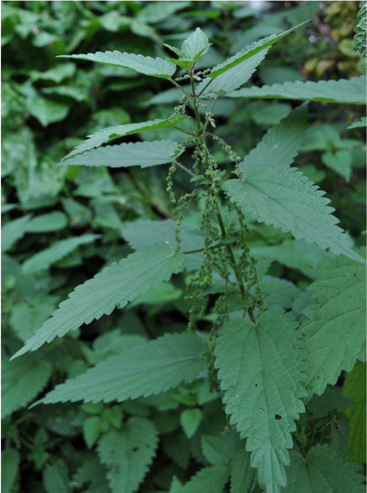
Brennnessel mit Samen

Gerne beschreibe ich hier, was wir daraus machen.