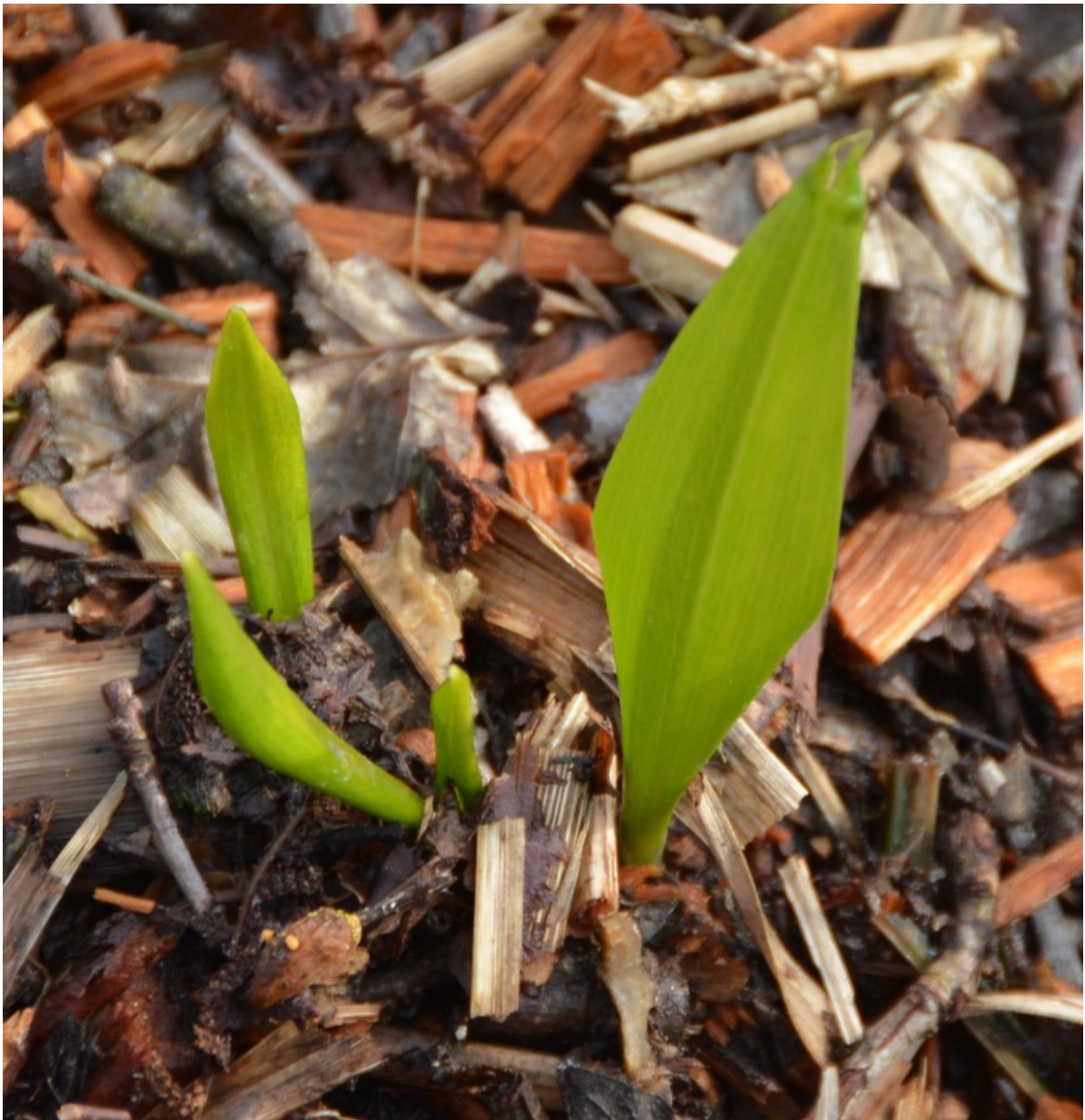
Erste Bärlauchblätter in unserem Garten.