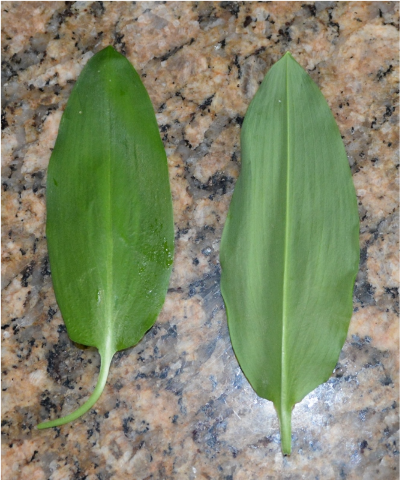
Oberseite links, Unterseite rechts