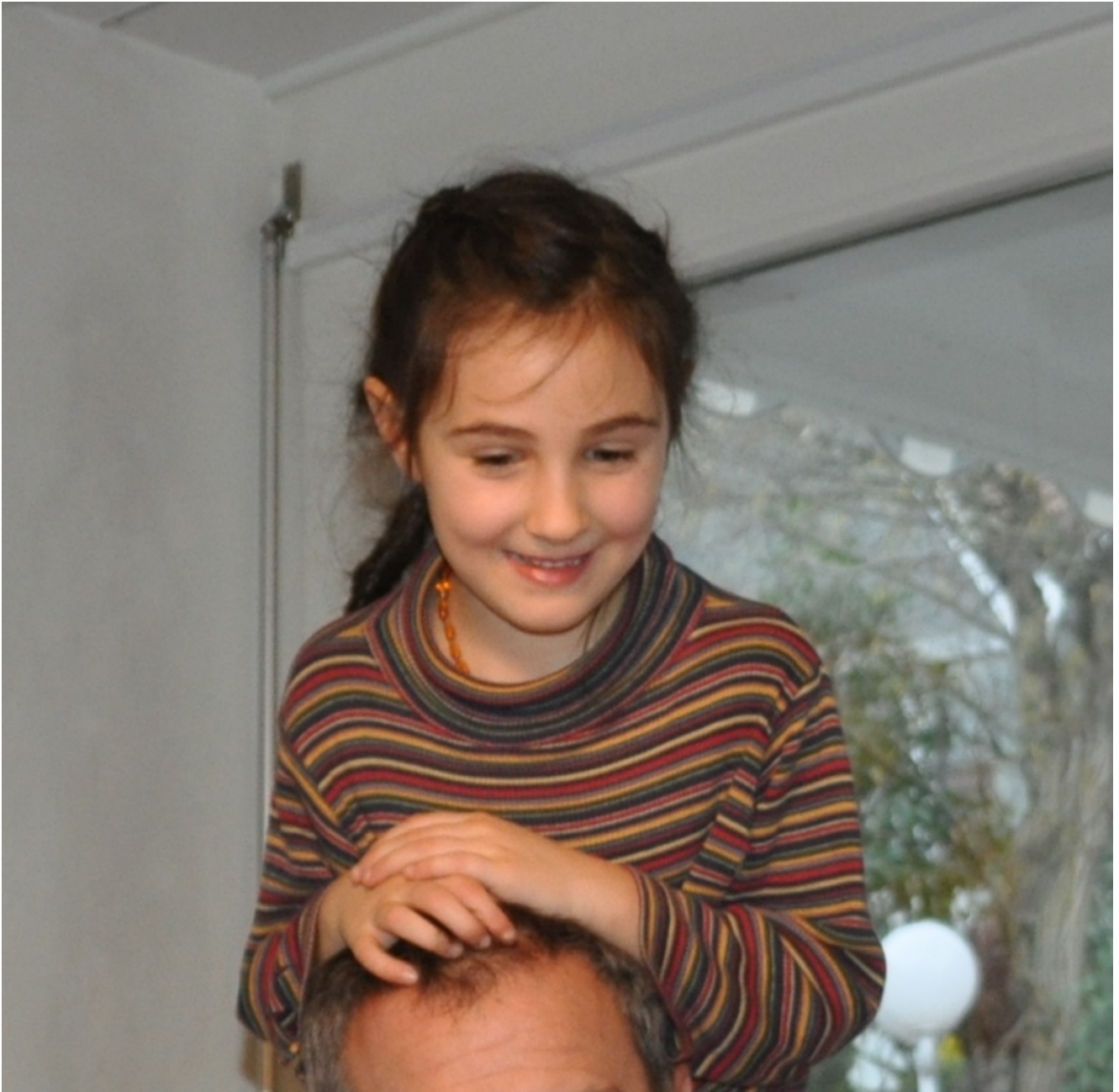
Meine Tochter im Alter von sechs Jahren am 14.Dezember 2014.