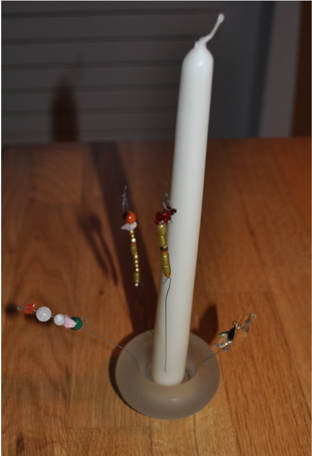
3. Teil der Bastelarbeit: Eine Kerze schmücken