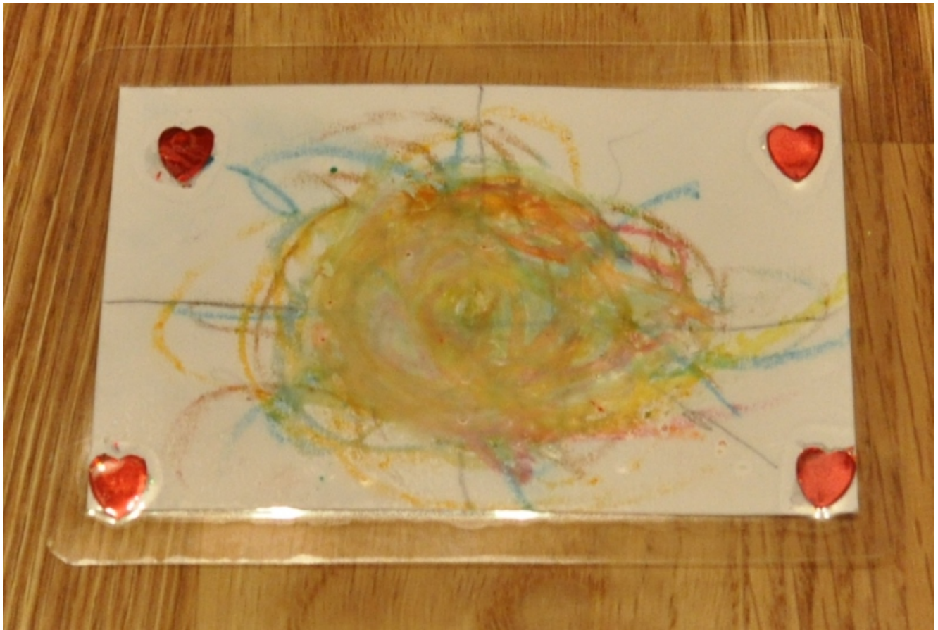
Dies ist eine der Karten von meiner Tochter.